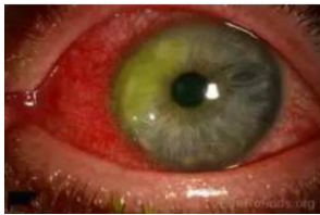
Gambar 5. Ulkus Kornea Marginal (9)