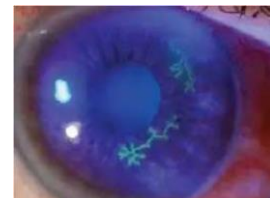
Gambar 2. Ulkus Kornea Virus (9)