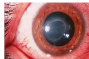
Gambar 4. Ulkus Kornea Acanthamoeba (9)