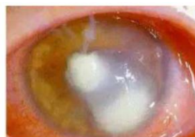
Gambar 1. Ulkus Kornea Bakterialis (9)