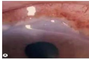
Gambar 6. Ulkus Kornea Mooren (9)