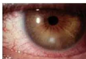
Gambar 3. Ulkus Kornea Jamur (9)